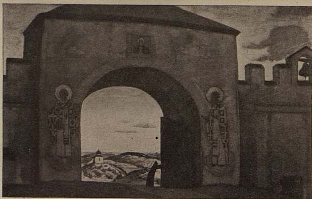
Съ картины Николая Рериха: «И мы открываемъ врата»