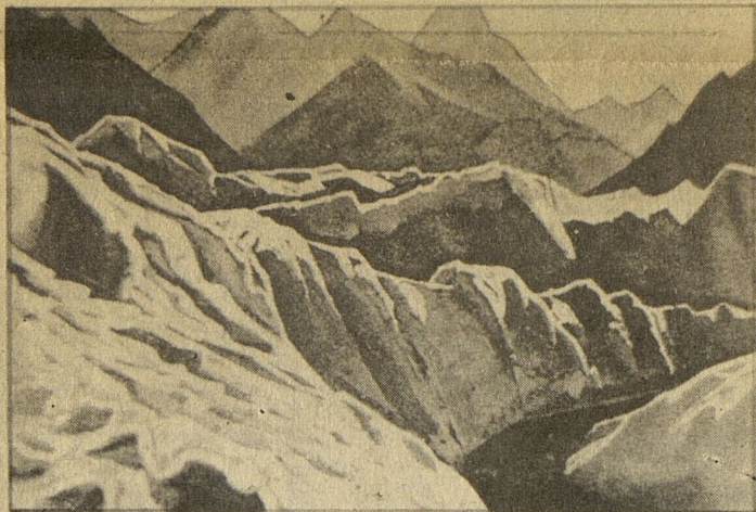
Николай Рерих. Гималаи. Рассвет в горах. 1941.