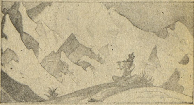
Николай Рерих. Кришна. 1933.