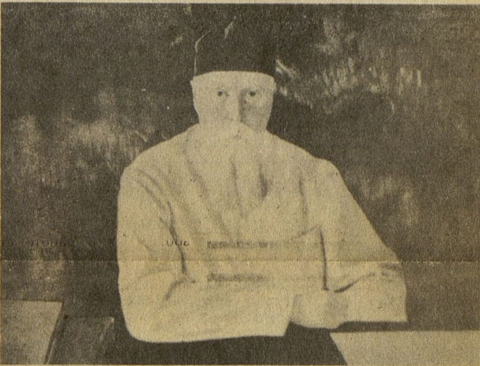
Святослав Рерих. Портрет Николая Рериха. 1937.