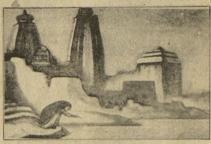
Николай Рерих. Огни на Ганге. 1945.