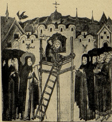
Преп. Андрей Рублевъ расписываетъ Спаса - Андрониковъ монастырь. (Изъ лицевой рукописи XV в.)