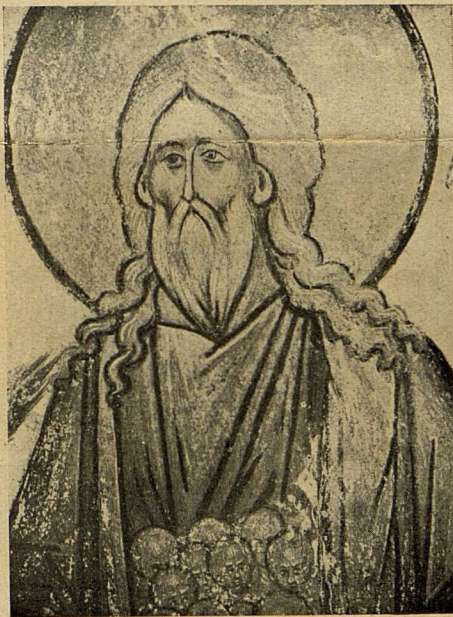
Часть фрески „Лѣно Авраамово“. XIV в. Владимірскій Успенскій Соборъ.

При этомъ способѣ краски также связывались известью, но наносились на просохшую известковую штукатурку, которая только намачивалась передъ работой. Гашеная известь, входящая въ составъ штукатурки, является связующимъ и закрѣпляющимъ веществомъ. Известь получается путемъ обжиганія известняковъ.