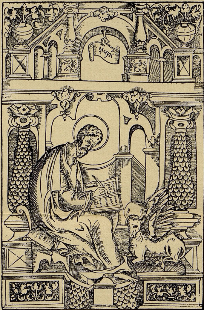
Изображеніе Евангелиста Луки изъ напрестольнаго Евангелія XVI в. московской печати.