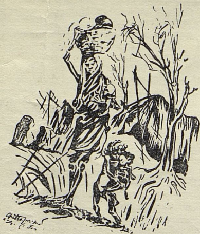
Картины голода в Бенгалии 1943 года (зарисовка из альбома индийского художника Шиттапрасада «Голодающая Бенгалия»).

На самом съезде атмосфера накалялась. Некоторые делегации, как, например, из Кашмира, Хайдерабада, пенджабских княжеств, Биканера, требовали активной борьбы против князей, сотрудничества с компартией, свержения монархического строя. Съезд уже готовился принять резолюцию. Перепуганное правительство Индии командировало на самолете в Гвалиор премьер-министра Неру уговаривать воинственных делегатов. Неру выступил с речью, в которой доказывал съезду «неразумность» подобных решений. Он указывал, что правительство не может якобы обойтись без сотрудничества князей, которых