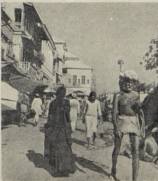
Улицы в старом Дели.

Коммунисты завоевали любовь крестьянства и личным примером солидарности. Во время голода в Бенгалии бригады коммунистов работали во всех деревнях. Пока члены Национального конгресса отсиживались в городах и принимали длинные резолюции, коммунисты создавали в Бенгалии лагеря для голодающих, организовали походные кухни, снабжали голодающих одеждой и т. п. В других провинциях коммунисты создали бригады, которые собирали средства для борьбы с бедствием. Повсюду многие крестьяне и крестьянки отдавали последние гроши, кольца и серьги, чтобы помочь своим братьям в Бенгалии. Бригады компартии собрали средств больше, чем было ассигновано на помощь голодающим правительством. Даже буржуазная печать была вынуждена признать, что никто не сделал так много для спасения голодающих, как компартия Индии.