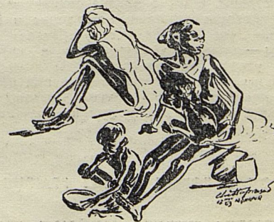
Картины голода в Бенгалии 1943 года (зарисовка из альбома индийского художника Шиттапрасада «Голодающая Бенгалия»).

В деревнях Бенгалии еще повсюду можно видеть следы страшной трагедии — голода 1943 года, унесшего три с половиной миллиона жизней. Много деревень пусто: хижин заросли бурьяном, джунгли наступают на дома, поля невозделаны. Это значит, что в 1943 году все население этих деревень вымерло или ушло на поиски пропитания в Калькутту, вернее, чтобы погибнуть от голода на ее улицах.