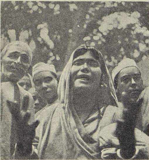
Крестьянка произносит речь на собрании.

нельзя отпугивать «крайними» лозунгами и призывами к борьбе с ними. В конце концов удалось навязать съезду оппортунистические, ни к чему не обязывающие резолюции.