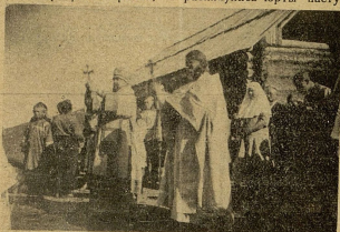
Архиепископ Нестор благославляет народ.

Иа России вывезали с собой русский уклад жизни, русские обычаи и крикло за них держались. Потому и чувствуют себя на трехреческих просторах как в России, хоть и попадаются там коренные жители, — монголы, соланы, да по всему пути, вплоть хлхата в длавые хутора Трехречья, — раскинулись юрты пасту-