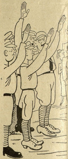
Торжественное привѣтствіе предвѣщало и

гребая, разбрасывали стороны разсыпанные галстуки. Лица нельзя было различить. Оно было залито бившей фонтаном из горла торчала большія ская ножницы.