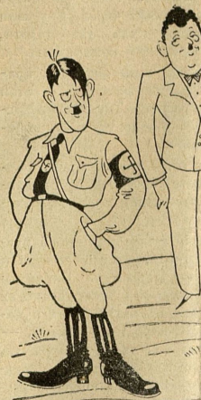
Безмятежная поза Гитлера что новой декларацией