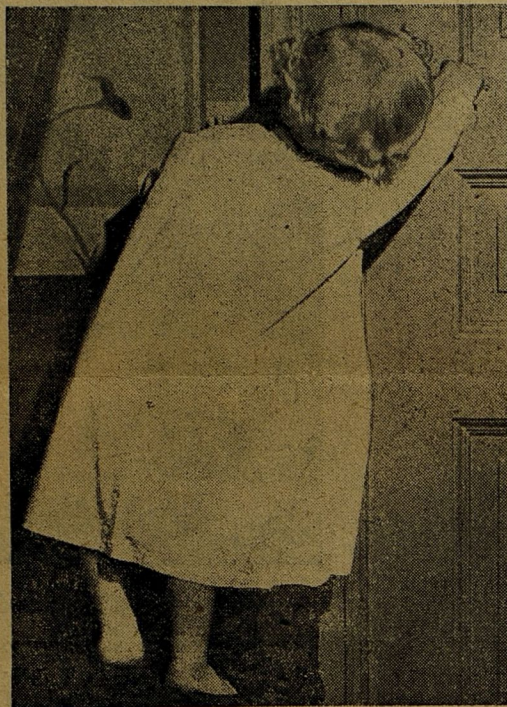
Что-то тамъ приготовила мама для меня?

На средней Волгѣ начата постройка величайшей въ мірѣ гидро-электрической станціи. При 17 агрегатахъ станція разовѣтъ мощность въ 3,4 милл. киловатъ, т. е. будетъ въ 4 раза сильнѣе Двѣпрогеса и въ 2,5 раза сильнѣе Ниагурской электростанціи.