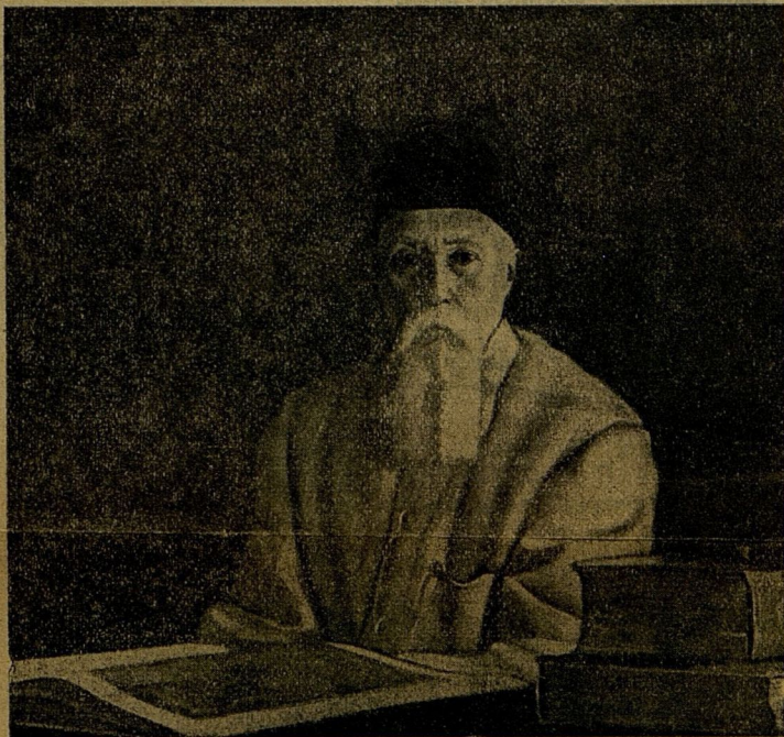
Академикъ Н. К. Рерихъ

будемъ ихъ вопленіе пророчествовать». Такъ и случилось. Вдругъ сдѣлалось принято мѣдлить по старымъ монастырямъ, заботиться о восстановленіи древнихъ фресокъ и восхищаться Новгородскимъ, Киевскимъ, и Московскимъ иконнымъ письмомъ. Открылись глаза на цѣннѣйшую художественную сторону иконописанія — вдругъ оказалось, что изъ среды народной постоянно выходили истинные художники. Одни изъ нихъ оставили намъ имена свои, но большинство прошло безымянно, а вѣдь и они эти