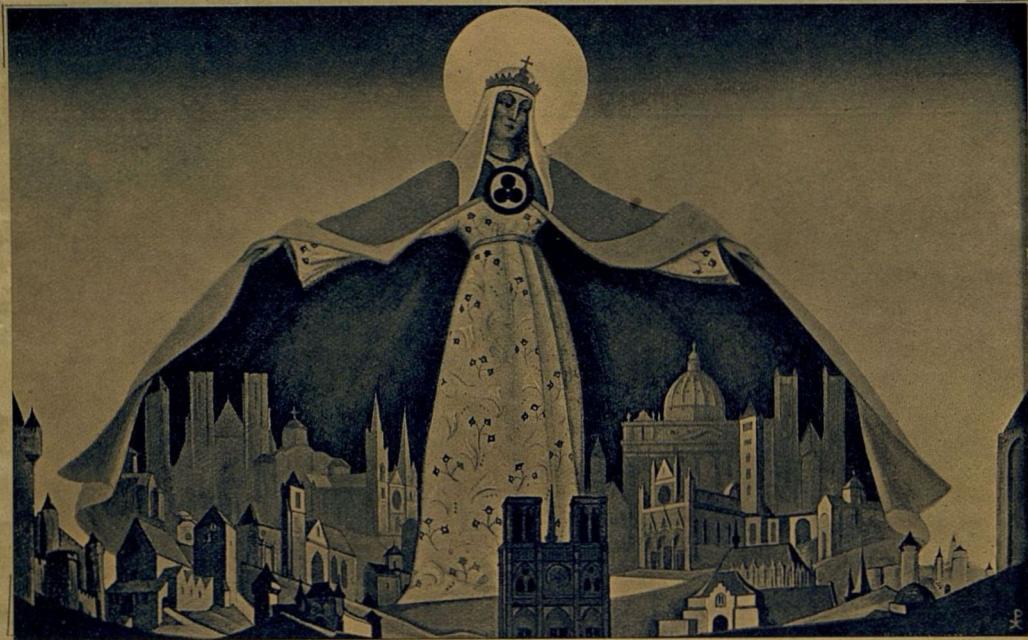
SANCTA PROTECTRIX par NICOLAS ROERICH (La Reine du Ciel protégeant les Sanctuaires).