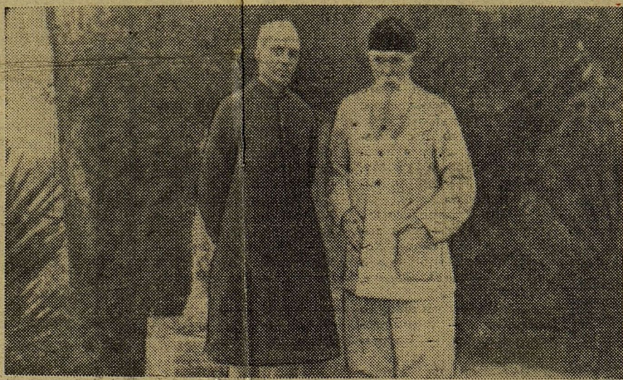
Джавахарлал НЕРУ в гостях у Николая Константиновича РЕРИХА, 1942 г.

«Точно неотпитая чаша стоит Русь. Неотпитая чаша — полный целебный родник. Среди обычного луга притаилась сказка. Самоцветами горит подземная сила. Русь верит и ждет... И не только в праздничный день, но в каждодневных трудах мы приложим мысль ко всему, что творится, о Родине, о ее счастье, о ее преуспеянии всенародном...»