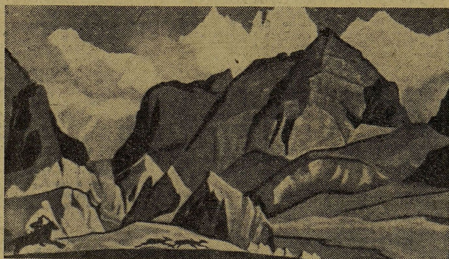
Н. К. РЕРИХ. «Охота».