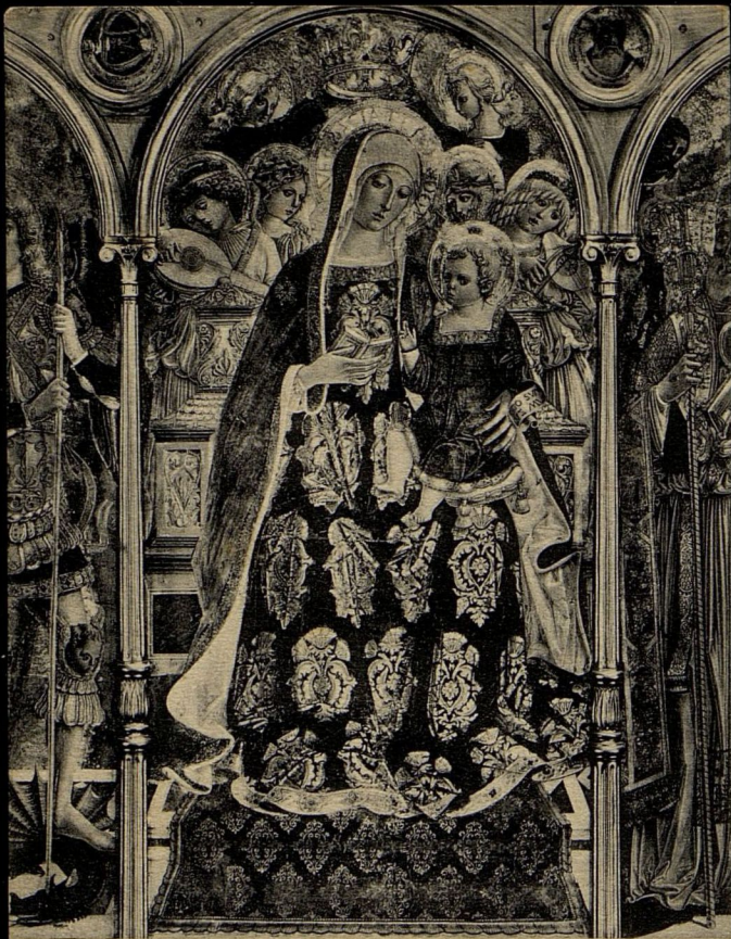
688 Siena - Accademia Belle Arti. Particolare del Trittico di Benvenuto di Giovanni.