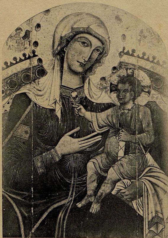
738 Siena - Accademia di Belle Arti. La Madonna con il Divin figlio sul Braccio Sinistro (Guido da Siena)