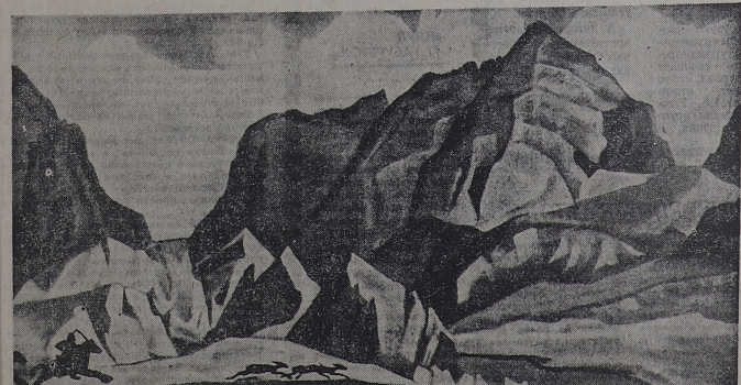
Н. К. РЕРИХ. «Спутник»

Нам сказали: «не езжай. Но мы все же поехали. Мы полюбил и вратам, Везде слышали слово «не езжай». Мы хотели сказать упрости, Нам сказали: «не езжай». Свет хотели зажечь.