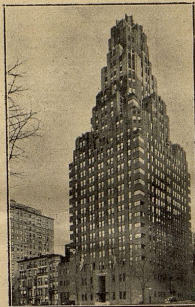
Rēriča Mūzejs Ņūjorkā.

Sieviešu Vienība un Panamerikas Sieviešu Asociācija, kas tiecas uz visu