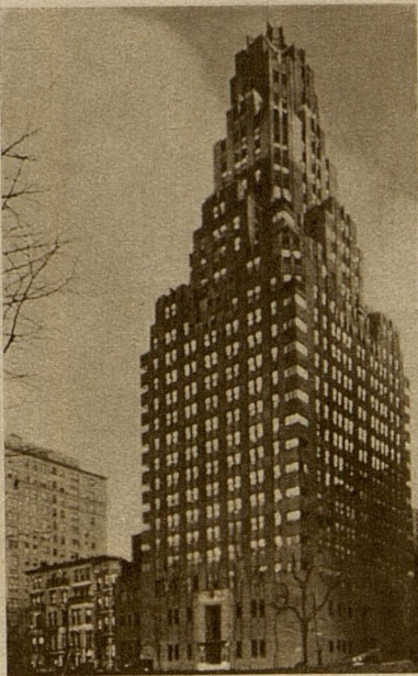
Rēricha mūzejs Ņujorkā.

Rēricha mūzeja lielais „Meistarumu nams“ ietver sevī arī t. s. Apartament Hōtel — dzīvokļu viesnīcu. Šī viesnīca atgādina internātu un domāta institūta skolniekiem un biedrības biedriem. Beidzot Rēricha mūzeja pārziņā atrodas arī Urusvati, Himalaju pētišanas Institūts , Indijas ziemeļos. Šis zinātniskais institūts cēlts 6000 pēdu augstumā, brīnišķīgajā Kulu kalnupes ielejā. Ar Rēricha mūzeja centru saistīts vēl kāds pasākums, kas guvis starptautisku ievēribu — Rēricha Miera karoga organizācija , kas uzņēmusies aizsargāt kultūras pieminekļus un svētnīcas pret barbarismu un nežēlībām kara un miera laikā. Kā zināms, šo paktu pieņēmusies visas Amerikas valstis. Tā N. Rēricha universālā, polifoniskā celtnē aug augumā. Viņas pamati — kultūra un daile, viņas jumols — tautu brālība.