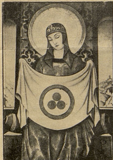
Miera karoga Madonna.

Beidzot kā R. biedrības starptautisks panākums mināms Rēriča Miera Karoga projekts, kura mērķis: aizsargāt visas pasaules kultūras, mākslas un zinātnes vērtības pret nežēlībām un barbarismu, kas izpaužas nevien kara, bet arī miera laikā. Šis aizsardzības plāns aptvers visus mūzejus, katedrāles, bibliotēkas, universitātes, pieminekļus, sabiedriskās un privātās mākslas un zinātnes kolekcijas; tālāk — dabas pieminekļus, skaistas vietas. Lai ap-