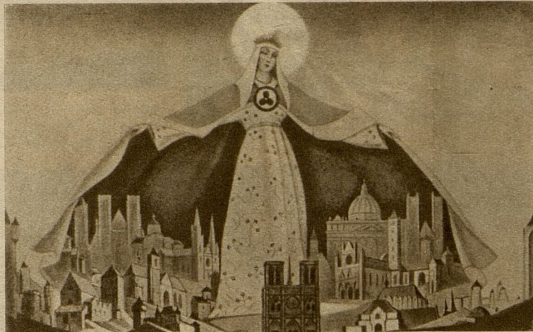
N. Rēricha glezna — Svētā visu svētnīcu aizstāve.