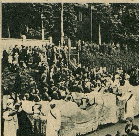
J. Akurateru izvada no sēru mājām I Uzkalniņā starp kokiem ra