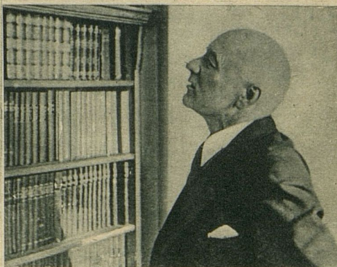
J. Akuraters pie savas bibliotēkas 1934. g.