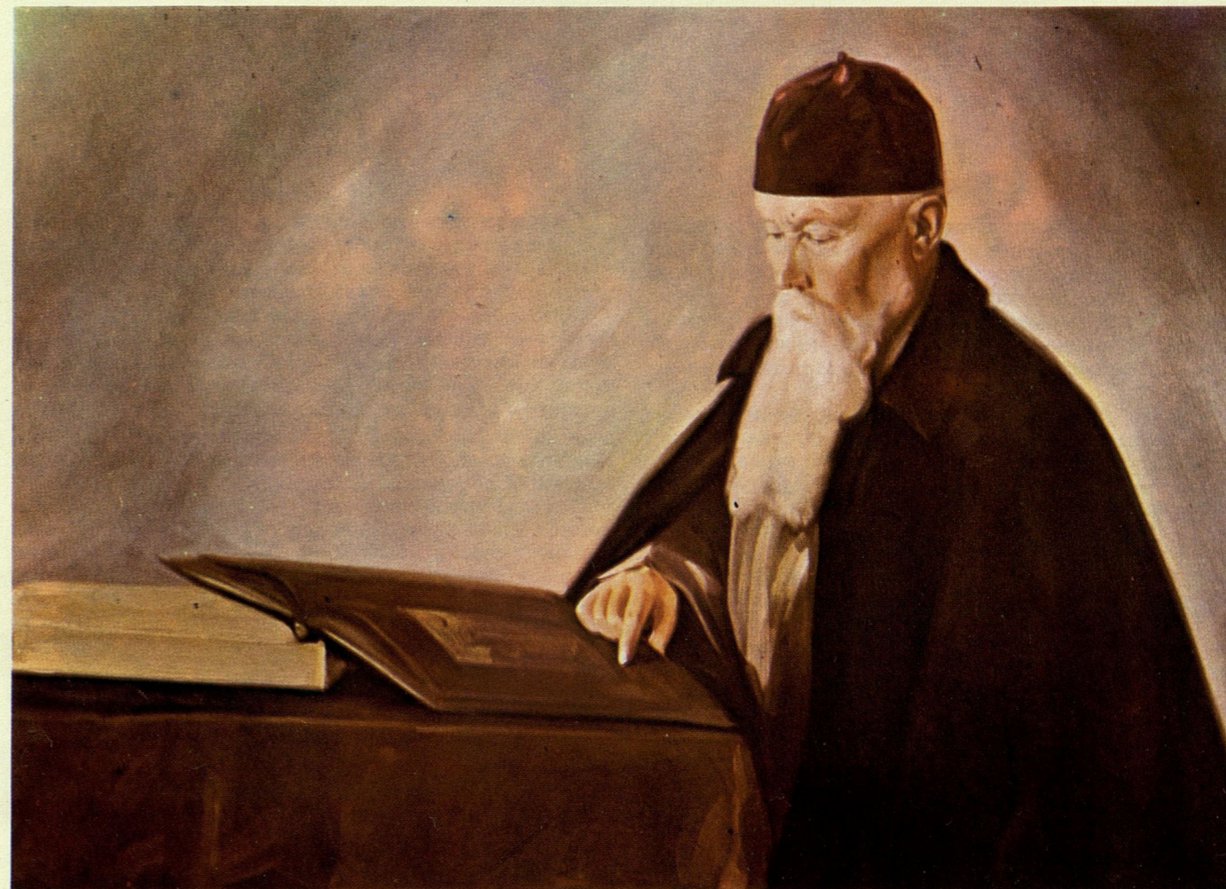
Портрет на проф. Николай Ръорих от Светослав Ръорих