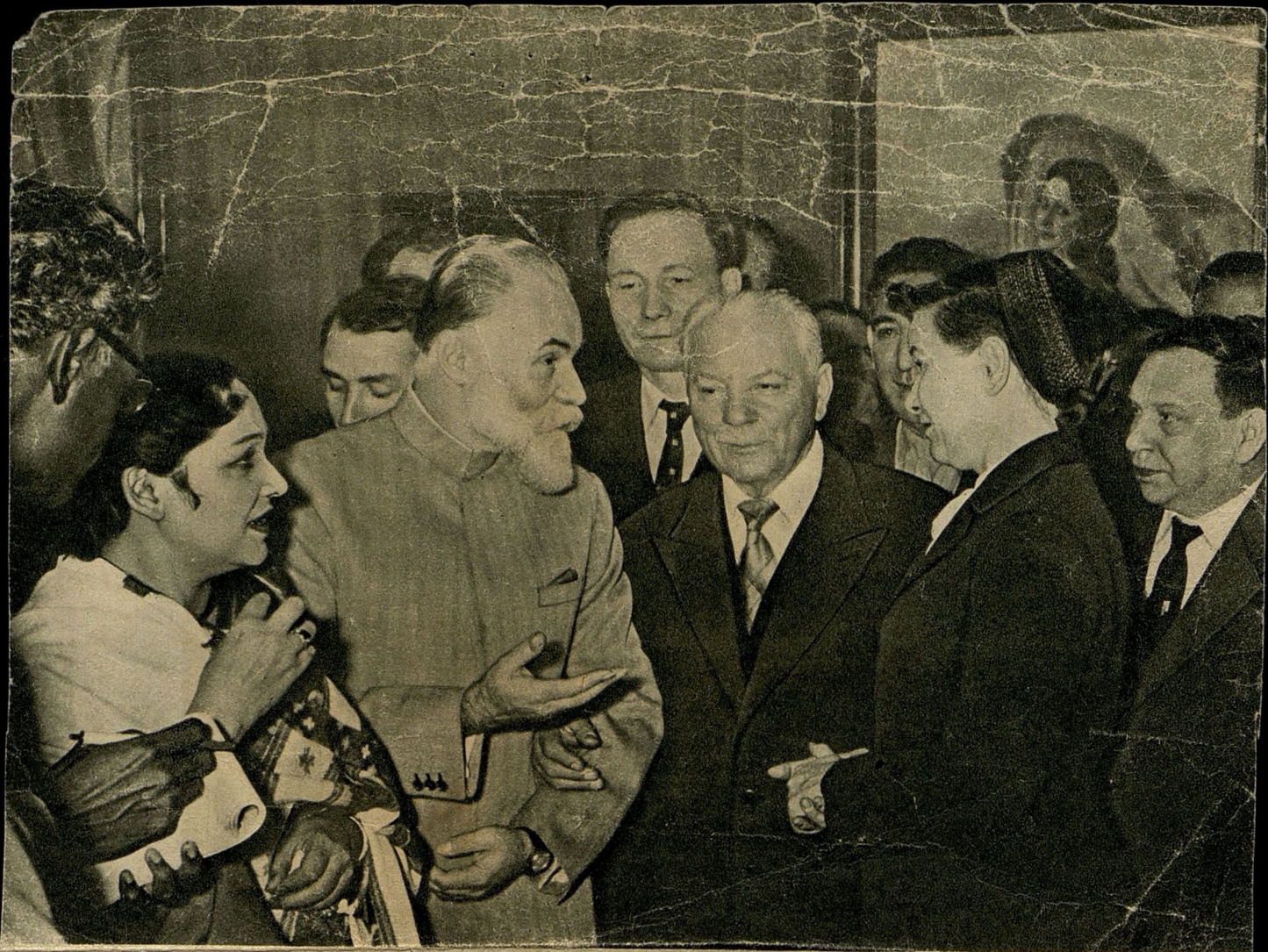
На выставке художника С. Рериха. Слева направо: С. Рерих с супругой, первый заместитель Министра иностранных дел СССР В. В. Кузнецов, К. Е. Ворошилов, Е. А. Фурцева и заместитель Министра культуры СССР Н. Н. Данилов